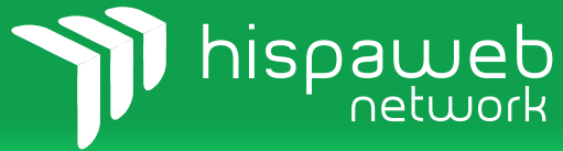
Imagen de Marca

En el diseño del logotipo se plantea una tipografía suave y liviana, de líneas curvas y trazo continuo sin variaciones de ascendentes y descendentes, logrando buena legibilidad y óptima relación de forma con el isotipo, transmitiendo modernidad y dominio de la tecnología.